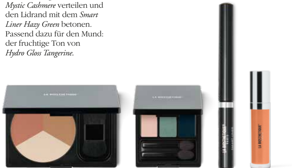
Contouring Powder 02 Magic Shadow Trio Mystic Cashmere Smart Liner Hazy Green Hydro Gloss Tangerine (v.l.n.r.)

Die neuen Looks feiern die natürliche Schönheit mit einem Zusammenspiel sehr subtiler Farben. Sie unterstreichen und akzentuieren, ohne sich in den Vordergrund zu drängen. Für den Tag ein Make-up der leichten Hand, das für den Abend mit etwas mehr Farbe an Ausdrucksstärke zulegt. Und so wird geschminkt: Den Teint mit Foundation grundieren und mit Contouring Powder 02 modellieren. Fürs Augen-Make-up Magic Shadow Trio Mystic Cashmere verteilen und den Lidrand mit dem Smart Liner Hazy Green betonen. Passend dazu für den Mund: der fruchtige Ton von Hydro Gloss Tangerine .