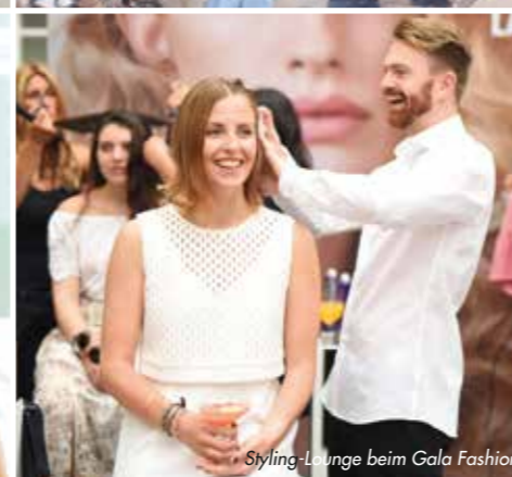
Styling-Lounge beim Gala Fashion Brunch