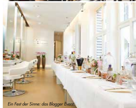
Ein Fest der Sinne: das Blogger Event