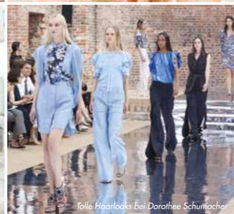
Tolle Haarlooks bei Dorothee Schumacher