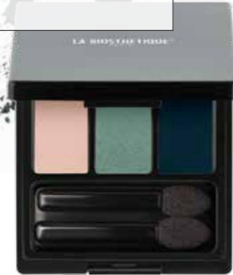
Magic Shadow Trio Mystic Cashmere