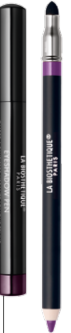
Eyeshadow Pen Smoky Violet Eye Performer True Purple

Rauchige Schattierungen für die Augen sind in dieser Saison besonders trendy. Sie wirken sanft und geheimnisvoll zugleich. Besonders geeignet dafür ist zum Beispiel der neue geschmeidige Lidschattienstift Eyeshadow Pen Smoky Violet in verhaltenem Violett. Passend dazu: der Kajalstift Eye Performer True Purple . Und für ein raffiniertes Spiel mit Highlights und rauchigen Schatten gibt es im Magic Shadow Trio Mystic Cashmere drei Nuancen – eine kieferngrüne, eine in Apricot und eine nachtblaue (s. Bild links).