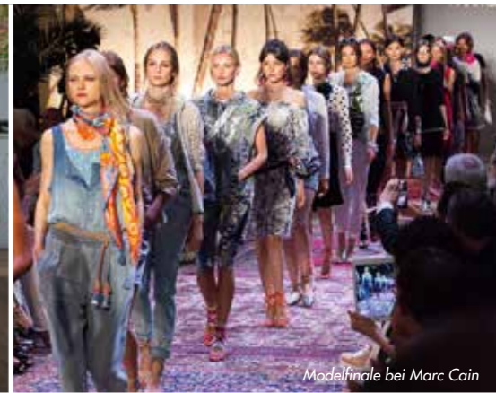
Modellfinale bei Marc Cain