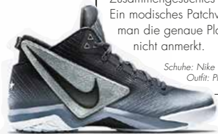
Schuhe: Nike Outfit: Philippe Plein

Kennzeichen des Rockabilly-Style: der Reiz von Gegensätzen, bei dem konventionelle Elemente auf wie zufällig Zusammengesuchtes treffen. Ein modisches Patchwork, dem man die genaue Planung nicht anmerkt.