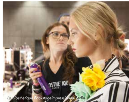
La Biothétique Backstageimpressionen Berlin