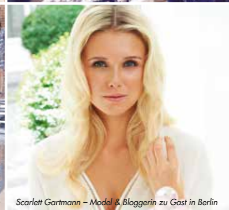
Scarlett Gartmann – Model & Bloggerin zu Gast in Berlin