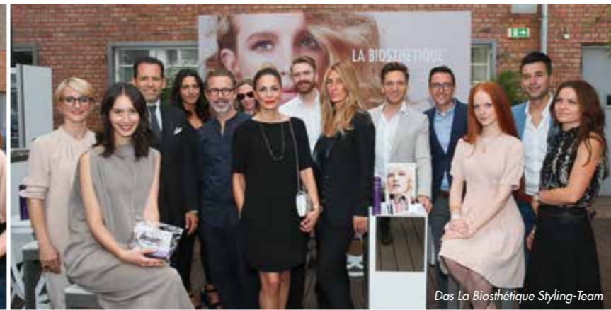
Das La Biothétique Styling-Team