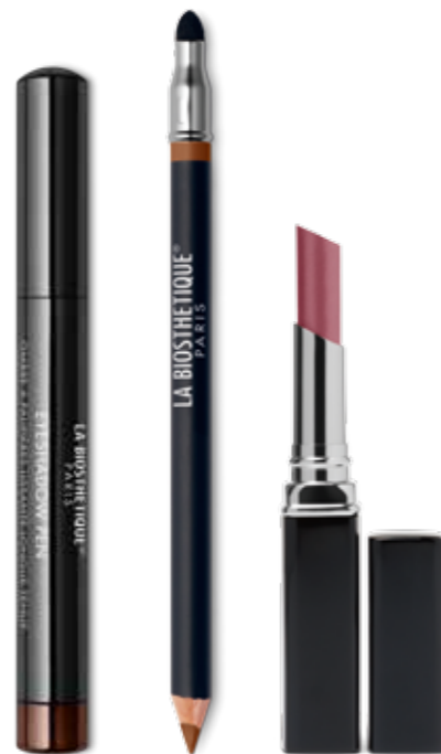
Eyeshadow Pen Brown Cinnamon Pencil for Eyes Caramel Silk True Color Lipstick Velvet Rose (v.l.n.r.)

Ein ausdrucksvoller Look in sehr warmen, unaufdringlichen Farben, die perfekt zu einem hellen, winterblassen Teint und zu jedem Typ passen. Wichtig auch hier: ein zarter, ebenermäßiger Teint, der je nach Gesichtsforn mit Contouring Powder 02 modelliert und belebt wird. Die Farben für die Augen: das schimmernde Zimtbraun des geschmeidigen Eyeshadow Pen Brown Cinnamon und das schmeichelnde Karamell von Pencil for Eyes Caramel Silk . Dazu ein kräftiger Akzent mit True Color Lipstick Velvet Rose .