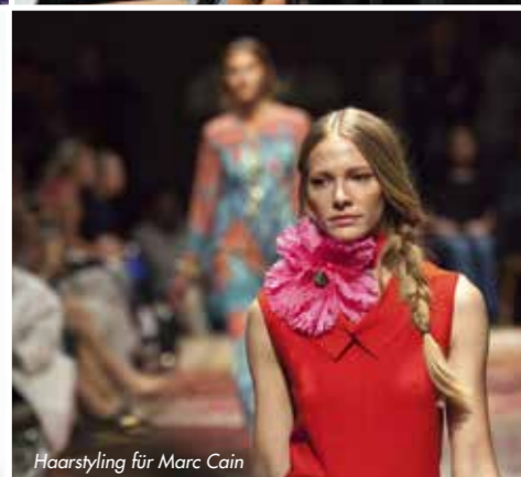
Haarstyling für Marc Cain