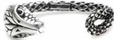
Messing-Armspange: Saint Laurent

Nach millionenfach angeklickten Katzenvideos und Dackelfeeds hat die Liebe zum Tier jetzt auch die Mode erfasst, und zwar flächendeckend bis in die höchsten Ränge. Die wilde Natur erobert gerade das urbane Leben. Professionelle Beobachter der internationalen Fashion-Shows meinten sogar, dass im Biotop der Mode gerade die Arche Noah vor Anker gegangen sei. Alles natürlich aufgedruckt, geprägt oder aus hochwertigen Kunstfasern gefertigt.