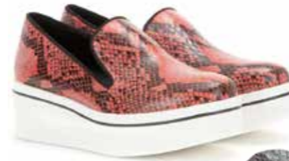
Schuhe: Stella McCartney Gürtel: Liebeskind Berlin

HAUTNAH! DAS TIER IN DER MODE KANN SICH AUCH UNTER EINEM HÖCHST SERIÖSEN BUSINESS-KOSTÜM VERBERGEN. DENN DIE DESSOUS-DESIGNER GEHEN EBENFALLS AUF SAFARI. GEGEN IHRE KREATIONEN SIND DIE HERSTELLER VON SNEAKERS UND GÜRTELN IM REPTILIEN-LOOK HARMLOSE CHORKNABEN.