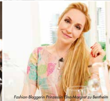
Fashion-Bloggerin Prinzessin Elna-Margret zu Bentheim